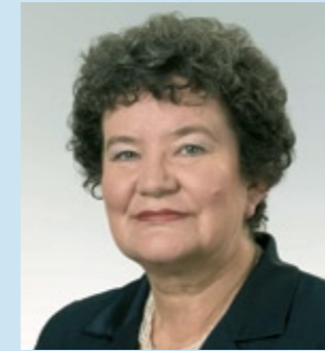
Professor Dr. Dagmar Schipanski, Präsidentin der Deutschen Krebshilfe

Deutsche Krebshilfe unterstützt weltweit erstes Zentrum für Kinderpalliativmedizin