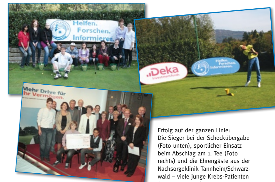
Erfolg auf der ganzen Linie: Die Sieger bei der Scheckübergabe (Foto unten), sportlicher Einsatz beim Abschlag am 1. Tee (Foto rechts) und die Ehrengäste aus der Nachsorgeklinik Tannheim/Schwarzwald – viele junge Krebs-Patienten (Foto oben links).

Baden-Baden (rb) – Am 3. Oktober 2009 fand der Höhepunkt der diesjährigen Golf-Benefiz-Turnierserie zu Gunsten der Deutschen Krebshilfe und der Deutschen Kinderkrebshilfe statt: Im Golf Club Baden-Baden traten die besten Spielerinnen und Spieler aus 147 lokalen Vorrundenturnieren zum Finale der 28. bundesweiten Golf-Wettspiele an.