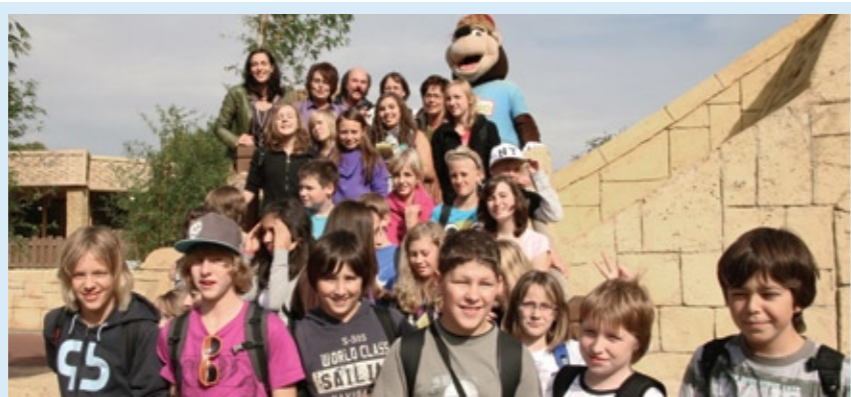
Gewinner eines Kreativ-Wettbewerbs: Die Klasse 7c der Gesamtschule Ahnatal in Vellmar.

„Ich finde es bewundernswert, wenn sich Schülerinnen und Schüler für ein rauchfreies Leben einsetzen“