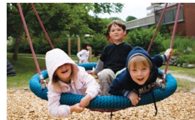
Patient ist die ganze Familie: Auch Geschwister krebserkrankter Kinder werden in Datteln begleitet und bei Bedarf unterstützt.