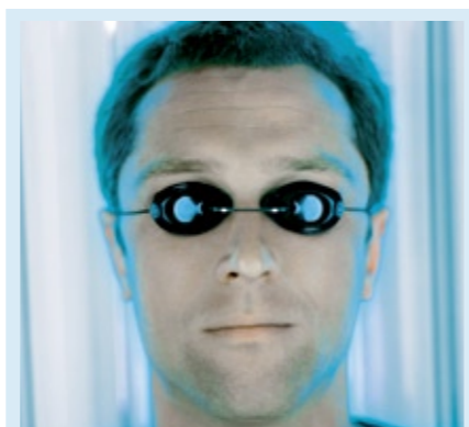
Künstliche UV-Strahlen können die Erbsubstanz zerstören. Die Folge: Hautkrebs.